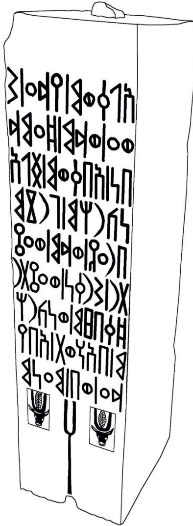
شكل 1: تفرغ للنقش هديل 1 (عمل الباحثة).